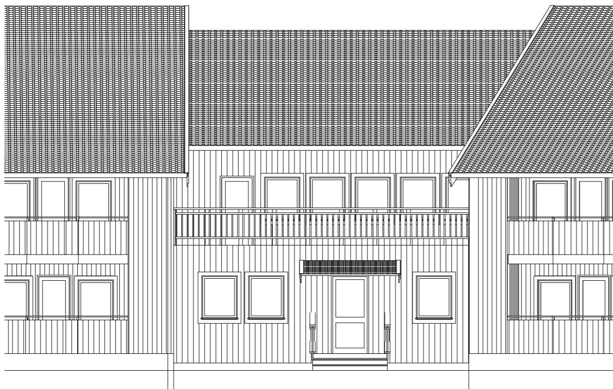
Fasad mot söder 1:100